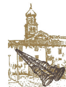
UDRUGA SOPACA OTOKA KRKA